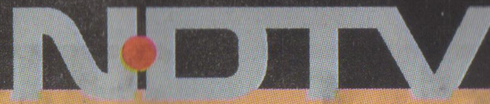
Statement of Standalone and Consolidated unaudited financial results for the Quarter Ended 30 June 2017 (Rs. in Lakhs except per share data)

CIN: L92111DL1988PLC033099 Regd. Off.: 207, Okhla Industrial Estate, Phase - III, New Delhi -110020 Phone: (91-11) 4157 7777, 2644 6666 Fax: 2923 1740 E-mail: corporate@ndtv.com; Website: www.ndtv.com